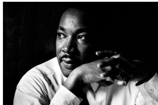
Martin Luther King

La humildad, como base de esos encuentros, implica una especie de muerte personal y de la necesidad de mostrar la superioridad propia, de creerse una élite de certeza inquebrantable. Alguien, alguna vez, le preguntó a Martin Luther King si siempre existirían grupos que se sintieran élite y que oprimieran a otros grupos. "Sí", respondió Martin Luther King, a menos de que todos tomemos consciencia del ser herido que hay en cada uno de nosotros, de nuestros miedos, de nuestras discapacidades profundas, de nuestras tinieblas. Entonces, la pregunta es: ¿Cómo vivir y acceder a esa humildad que nos permita ver lo Divino en el otro? ¿Cuál es la transformación que hay que vivir y cómo? ¿Acaso no es esa la pregunta esencial en El Arca?