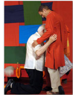
Gesto de perdón de Jean Vanier

« Tenemos una gracia excepcional en el Arca y es en efecto verdad, los más pequeños cuidan de nosotros y... cuando llegamos a mi edad -y todavía me siento joven-, yo quiero pedir perdón; porque se que pedir perdón es necesario cuando se ejerce la autoridad, porque no siempre estamos a la escucha como debería ser. Hemos hecho daño y por eso yo pido perdón”