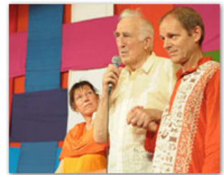
Jean Vanier y los coordinadores internacionales

A propósito de la fiesta de su 80° cumpleaños, Jean Vanier, dijo: